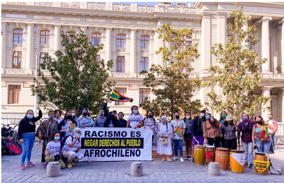
Figura 2. Manifestación del Pueblo Tribal Afrodescendiente Chileno a las afueras de la Convención Constitucional, marzo de 2022. Colectiva de Mujeres Afrodescendientes Luanda.