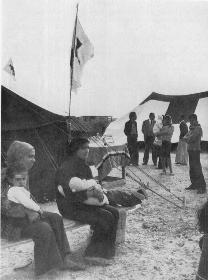
En el hospital de campaña del CICR en Beirut, varias personas desplazadas esperan la asistencia de los médicos del CICR.